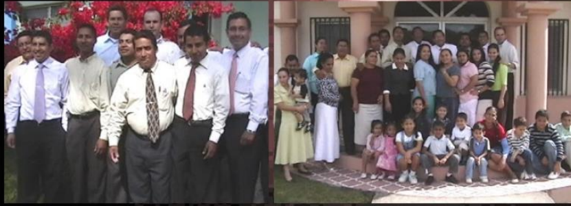
Campamento de Familias Pastorales 2.007