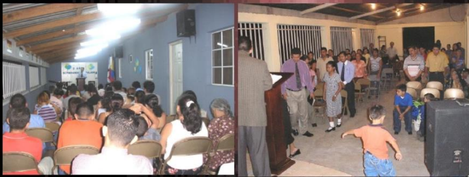
Congregaciones que pastorea la Familia Misionera al 2008. La primera que aparece, es la de la ciudad de San Pedro Sula en la Colonia Montefresco y en cuya misma casa reside la familia misionera. En la segunda se contempla la de Brisas del Valle, que ha ayudado a fundar dos obras más: El Progreso y Pinalejo.