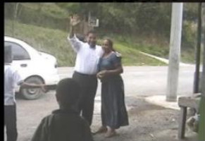
Escuela Bíblica Vacacional