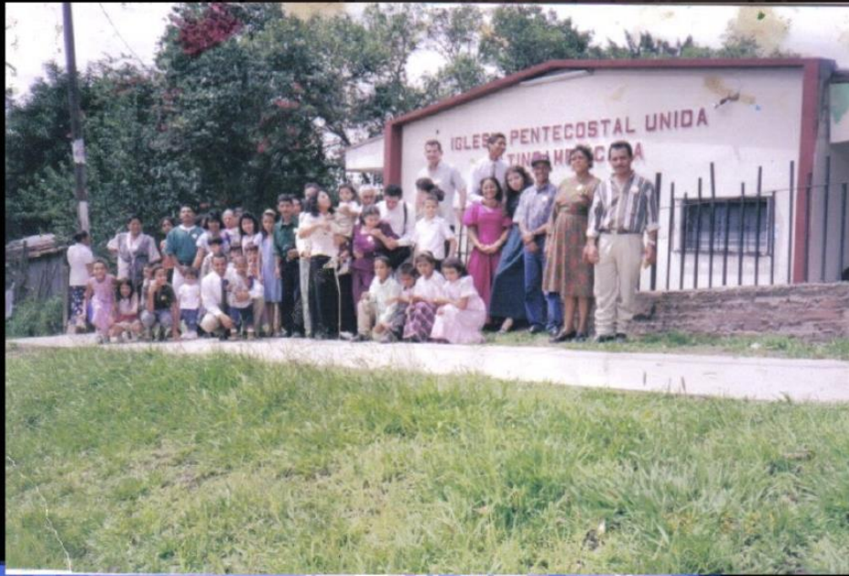
Tegucigalpa, Junio 9 de 1999. Aspectos de la celebración del primer culto de la Iglesia en Tegucigalpa, en su templo recién comprado. Un gran paso para la iglesia que Avanzaba al tener su Primera Propiedad adquirida con aportes de la Iglesia en Colombia, Honduras y la familia misionera.