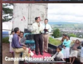
Campana Nacional 2006