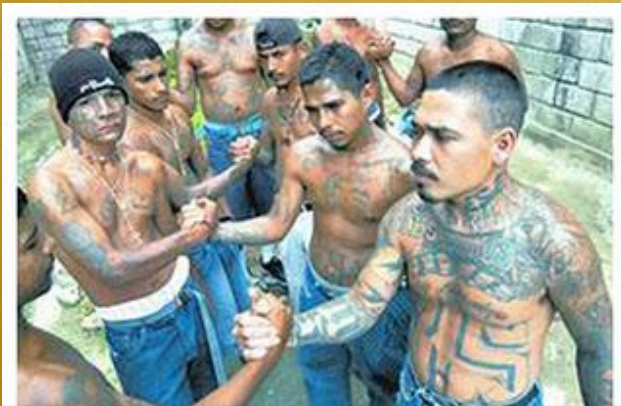
Grupo de Pandillas “Maras”

Oremos para que el Señor les revele su Nombre