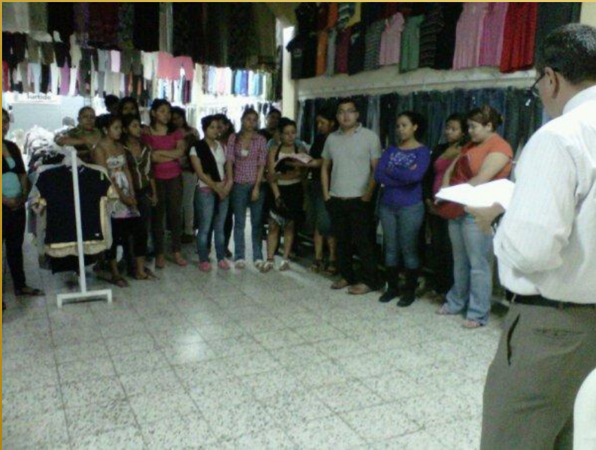
Grupo de Simpatizantes

Estamos predicando el evangelio en un lugar del centro de Tegucigalpa donde están escuchando la palabra de Dios, mas de 30 personas con sed de Dios. Estamos orando para que el Señor siga tocando sus vidas y se conviertan a Él.