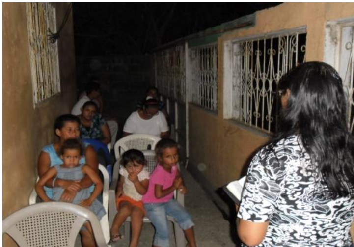
REUNIÓN FAMILIAR EN LA COLONIA LOS LAURELES EN LA CEIBA (ATLÁNTIDA)

TENEMOS REUNIONES FAMILIARES EN LOS HOGARES DE ALGUNAS COLONIAS COMO SON: LOS LAURELES, SAN JOSÉ, SAN JUDAS Y JUTIAPA.