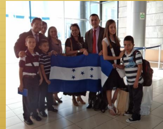
Llegada a Honduras