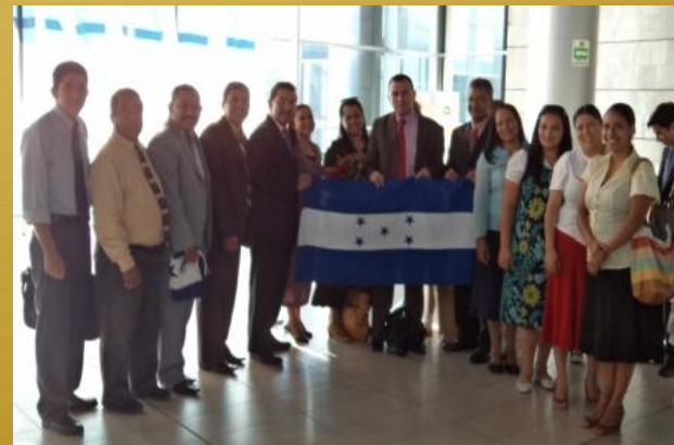
Pastores presentes en la llegada a Honduras