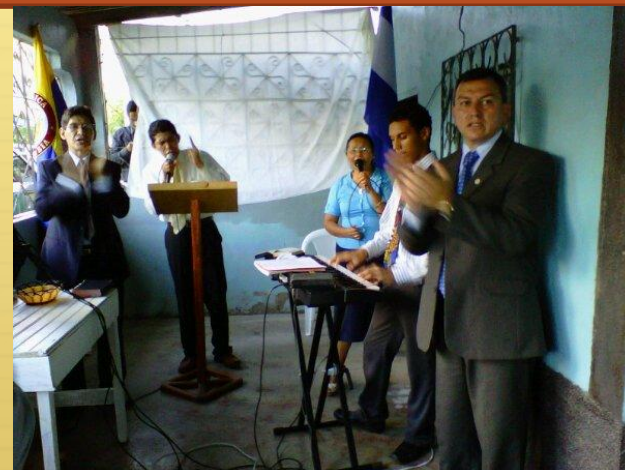
Tocoa - Colón

En este momento tenemos 3 lugares que estamos proyectando para dar apertura como obras nuevas. Una en Tocoa departamento de Colón, otra en la colonia de Kennedy en Tegucigalpa y otra en Choloma – Cortez. Rogamos sus oraciones para que el Señor provea hermanos dispuestos para trabajar en la obra de Dios, asimismo la economía para poderlos sostener.