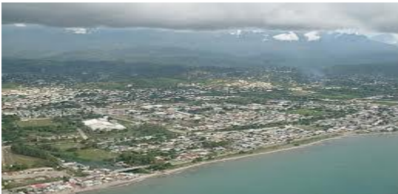
CIUDAD DE LA CEIBA - HONDURAS

“Mas gracias sean dadas a Dios que nos lleva de triunfo en triunfo en Cristo Jesús, y por medio de nosotros manifiesta en todo lugar el olor de su conocimiento” 2ª Cor. 2;14