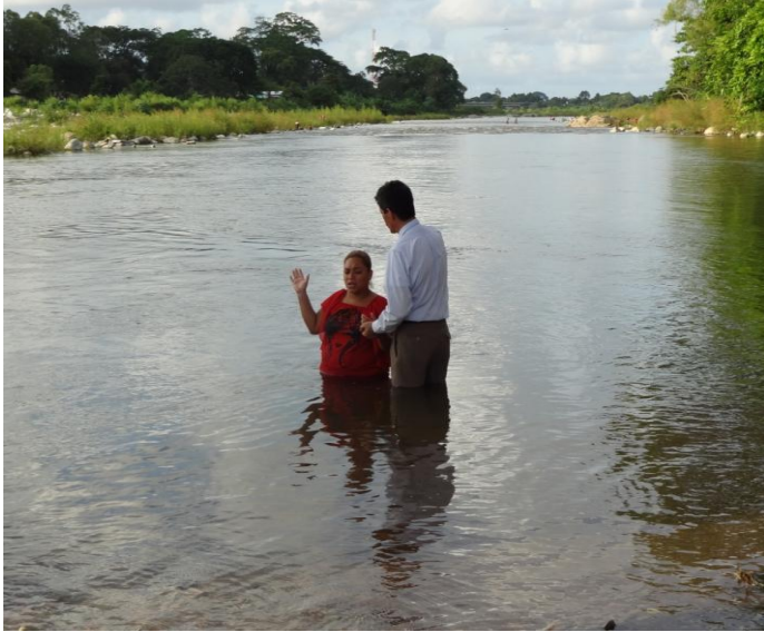
BAUTISMO EN LA CEIBA