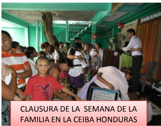
CLAUSURA DE LA SEMANA DE LA FAMILIA EN LA CEIBA HONDURAS

SE REALIZO LA SEMANA DE LA FAMILIA EVENTO QUE SE LLEVO A CABO EN EL MES DE AGOSTO, DEL 25 AL 28 LO CUAL FUE DE MUCHA BENDICIÓN DONDE DIOS NOS PERMITIÓ COMPARTIR CON MI ESPOSA UNAS BONITAS ENSEÑANZAS Y ALGUNOS AMIGOS NOS ACOMPAÑARON. EN LOS CULTOS DE ESTE EVENTO UNA SEÑORA QUE LLEVABA ALGUNOS AÑOS EN UNA CONGREGACIÓN TRINITARIA EMPEZÓ ASISTIR CON NOSOTROS