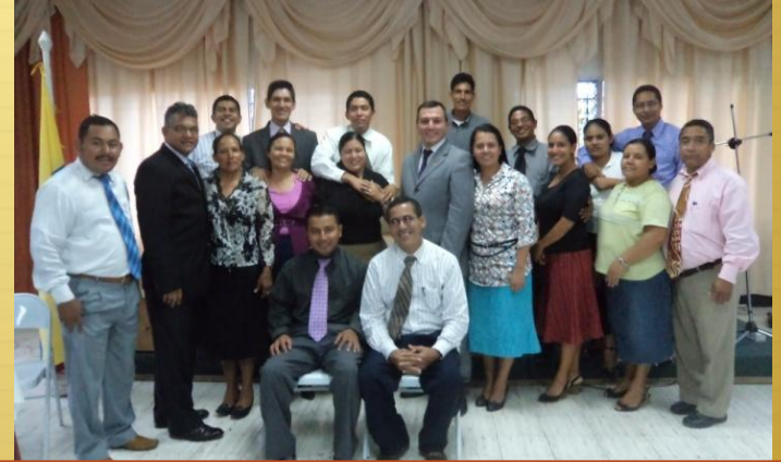
Grupo de Pastores, Ejército del Señor en Honduras