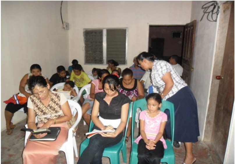
ESTE ES EL SALÓN QUE PRESTARON PARA HACER LOS CULTOS EN TOCOA, (COLON) HONDURAS