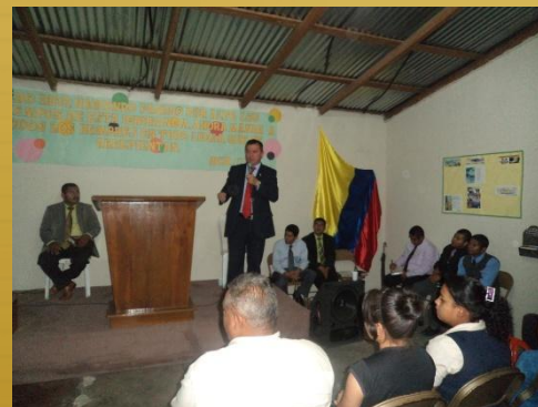
Iglesia en Comayagua y Laureles