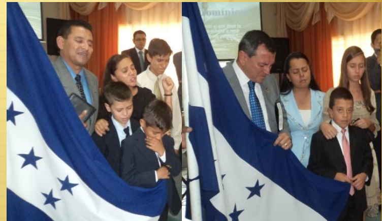
Ceremonia de Despedida y Posesión

“Yo planté, Apolos regó; pero el crecimiento lo ha dado Dios” 1 Corintios 3:6