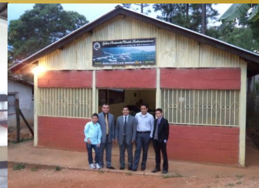
Iglesia Sabanagrande y Valle de Angeles.