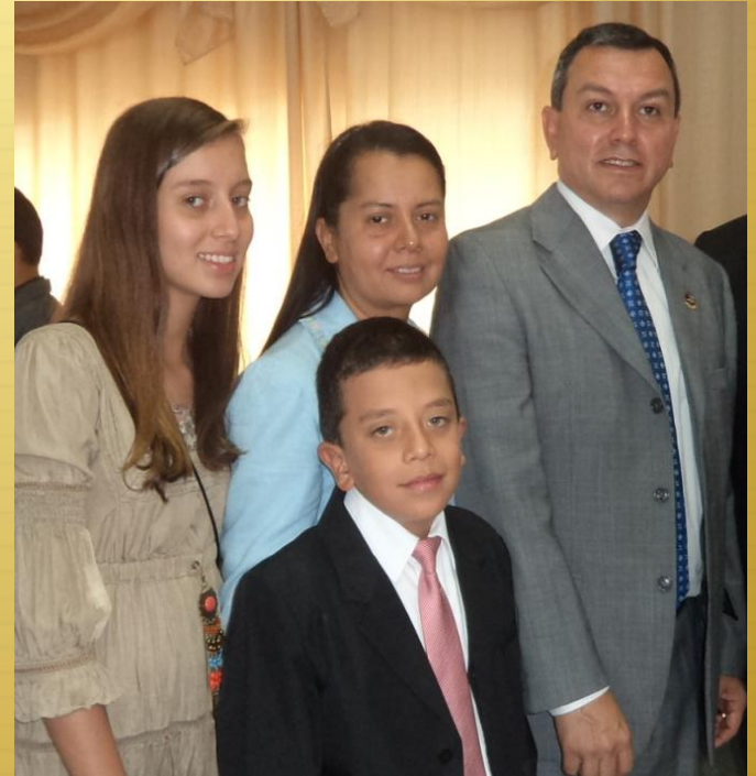
Familia Misionera Honduras

Sigan trabajando y apoyando la labor misionera en Honduras y en todos los países donde se está predicando este glorioso mensaje.