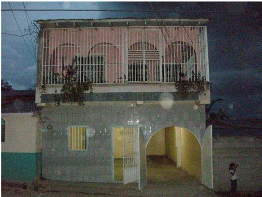
11. TEGUCIGALPA, COLONIA BRISAS DE LA LAGUNA. En este edificio alquilado se celebran los cultos de esta nueva obra ¡Un Aposento Alto!