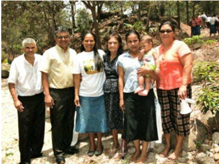
06. TEGUCIGALPA, CENTRAL. Grupo de sus últimos bautizados. ¡Tiempo de Cosecha!