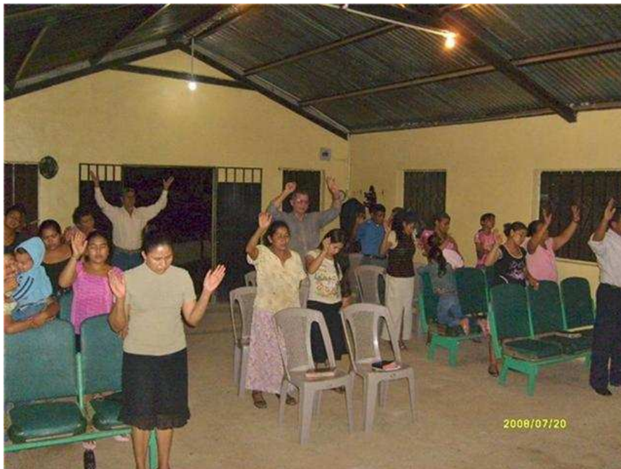
15. SABANAGRANDE, F.M. A una hora de Tegucigalpa. Aquí celebran gozosos un culto en su templo propio.