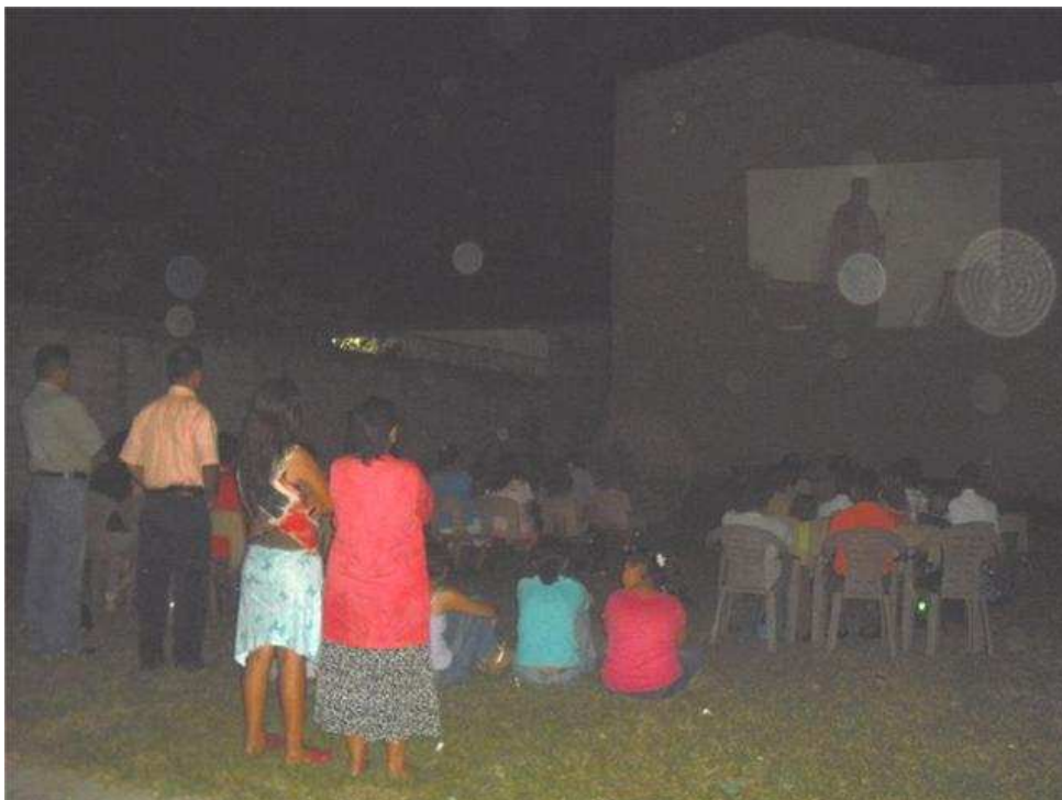
29. SAN PEDRO SULA, IGLESIA CENTRAL. Mientras construyen su templo aprovechan el terreno para actividades evangelísticas. Aquí aparece la presentación de una película Juvenil.