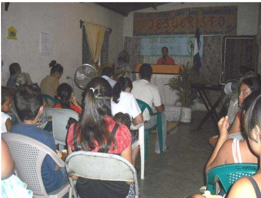
40. EL PROGRESO, YORO. Este culto que muestra a la Iglesia que no deja de trabajar por las almas. La congregación nació gracias a una REFAM enviada desde san Pedro. ¡Gloria a Dios!