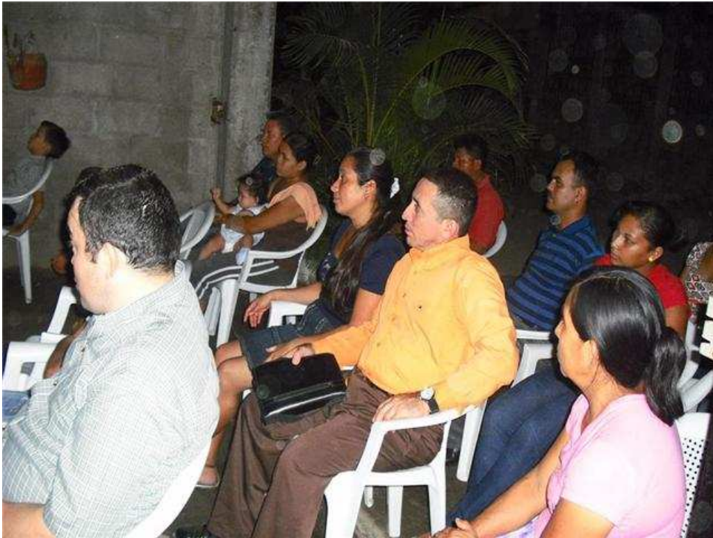
36. SAN PEDRO SULA, COLONIA CIUDAD NUEVA. Esta congregación nació gracias a los adolescentes que asistían a clases de barrio allí. ¡La revelación de su Nombre está siendo recibida!