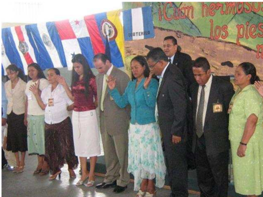
50. COMITES NACIONALES DE LA IPUL EN HONDURAS. En la pasada Convención el Misionero presentó a los líderes de esta vigencia. ¡Dios les siga usando poderosamente para más Victorias!