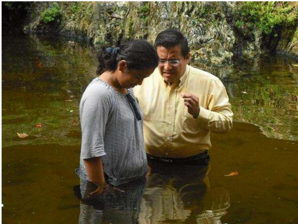
31. SAN PEDRO SULA, IGLESIA CENTRAL. Uno de los ultimo bautismos de esta congregación que pastorean los Misioneros. ¡Gracias Señor por el fruto de tu Sangre!.