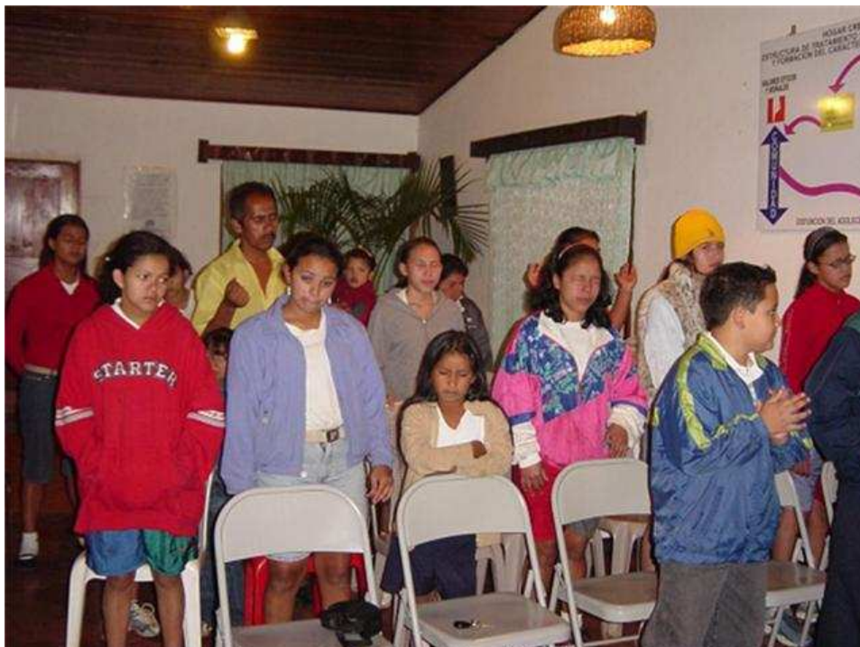
19. VALLE DE ANGELES F.M. Aquí esta bonita Iglesia visitando uno de los hogares de rehabilitación para jovenes donde el Señor les ha dado almas. ¡Visión y carga!