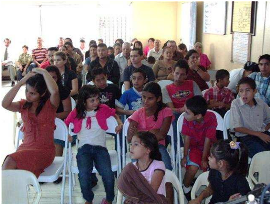
05. TEGUCIGALPA, IGLESIA CENTRAL. Aspecto parcial de la primera congregación del país. Ayudan a su pastor en la apertura de las nuevas obras de la capital. Por su crecimiento en almas, su salón pronto será ampliado.