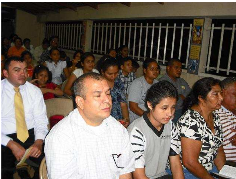
24. SAN PEDRO SULA, IGLESIA CENTRAL. Así son los cultos donde su presencia divina la sienten hasta los amigos que siempre traen los creyentes. ¡Salvos para servir! es su lema.