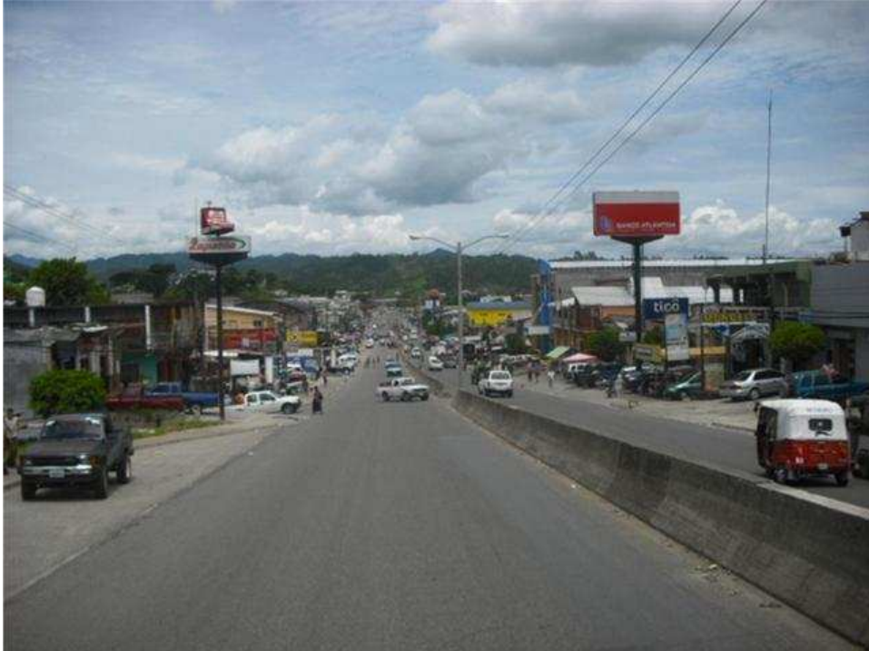
43. LA ENTRADA, COPAN. Es la ciudad más comercial de este departamento turístico. Hay doce bautizados allí pero se encuentran actualmente sin pastor ¡Roguemos al Señor por obreros!