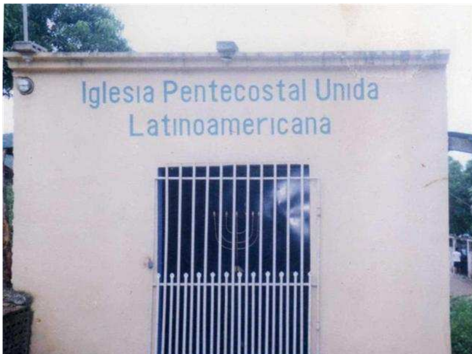
33. SAN PEDRO SULA, COLONIA BRISAS DEL VALLE. Este es el templo propio de la segunda iglesia en san Pedro. De allí han salido dos obreros y tienen un programa por T.V. en un canal Zonal ¡Misionera!.