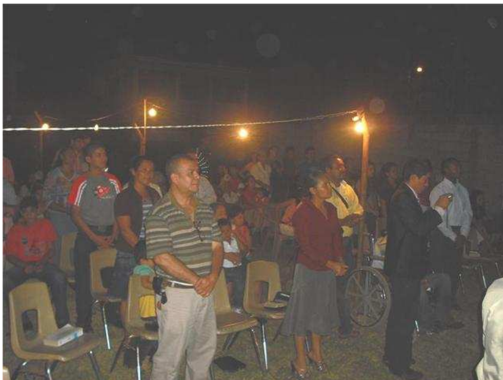
27. SAN PEDRO SULA, IGLESIA CENTRAL. Los fines de semana celebran el culto en el terreno que están pagando, aprovechando el verano.¡Sabor a campaña!