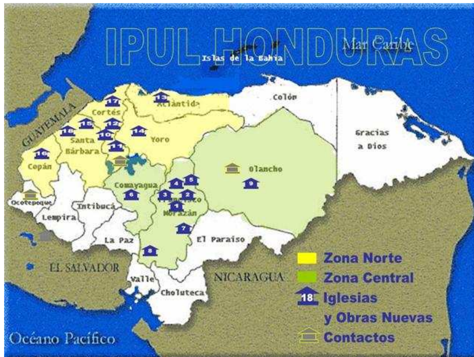
02. La Iglesia en Honduras y su presencia en el País. En dos Zonas están distribuidas 18 congregaciones, pero...¡Mirad los Campos Blancos!