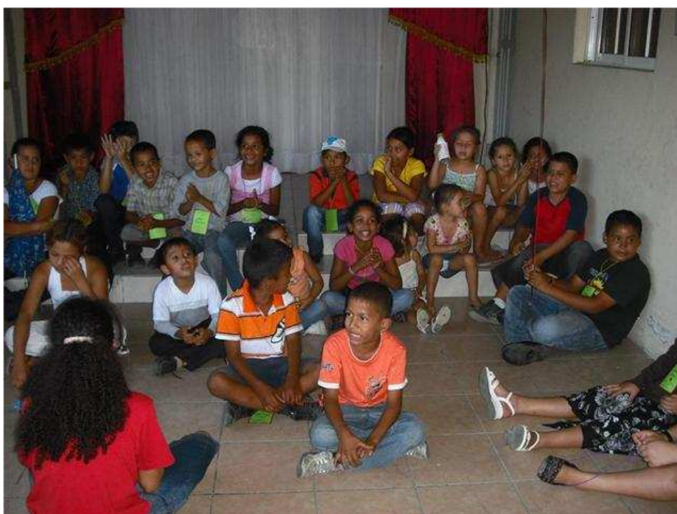
25. SAN PEDRO SULA, IGLESIA CENTRAL. Ya hay cuatro maestros con los cuales se está alcanzando la niñez. Aquí aparecen en clase.