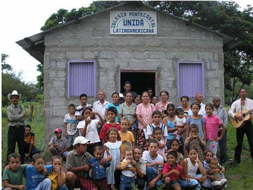
22. LA JAGUA, OLANCHO. Esta congregación fue abierta cuando la gente oyó la doctrina por radio y pidió que fuesen a predicársela. Ubicada a 5 horas de la capital.